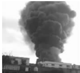
火灾现场浓烟滚滚

快报讯(记者 何洁) “昆山一炼油厂发生爆炸起火,已经烧了2个多小时。”昨天下午,有网友在微博上爆料。现代快报记者求证后获悉,事故并非爆炸,而是昆山一家公司的润滑油仓库起火,造成一名仓库保管员轻伤。据了解,昨天下午3时许,昆山市蓬溪路上的昆山金佰利工贸有限公司突发火灾,该公司是一家专门从事润滑油加工的企业,失火仓库中储存的产品是润滑油。昆山消防调集多辆消防车前往救火,火灾于下午5点被成功扑灭。有知情人士称火灾原因初步判断为设备老化,目前事故详细原因还在调查中。