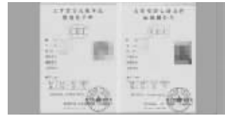
大学英语四六级证