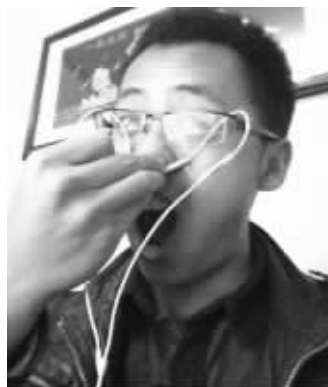
网友晒出测试“嘴巴音箱”照片