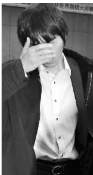
李世石似乎不敢相信自己赢了

赛后,擅长乱战的李世石都有些看不透比赛,“我的形势一直不好,但不知道为什么后半盘所有的结果运行得都很好。”李世石和韩国方面的工作人员会面,挠着头,似乎还没从刚才的乱局中回过神来,“与其说结果是我赢了,倒不如说是个意外。”