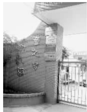
江都童之梦幼儿园被曝收取“拥抱费”

品园项目是我们幼儿园的一大亮点,应该说家长都比较认可。我们在进行这个项目之前,也已经对家长告知,有针对性地与家长进行汇报交流,而这个收费我们也已经列入正常收费汇总,这个项目持续进行了,幼儿园品质也提升了,很快乐很温馨。”冯园长表示,目前收费已经报请江都区物价局备案,“已经备案了,我们打了报告,算在保育费费用里面。”