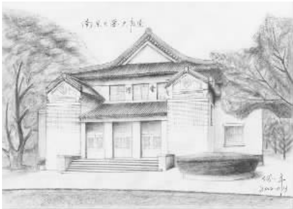
南京大学大礼堂