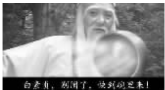
白素贞,别闹了,快到碗里来!