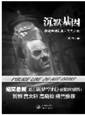
黄序著 长江文艺出版社友情推荐