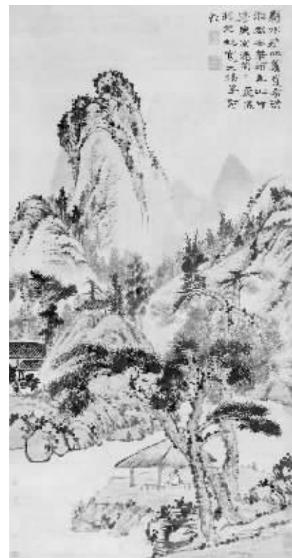
石涛的《剩水残山》在北京匡时秋拍以3565万元成交

据悉，保利古代书画夜场总成交额2.37亿元，其中，“明四家”沈周作品《思萱图》以2300万元列本场成交额第二名，而记录钓鱼岛铁证的重要文献，清代钱泳的《记事珠》也以1782.5万元的高价被爱国藏家收藏。