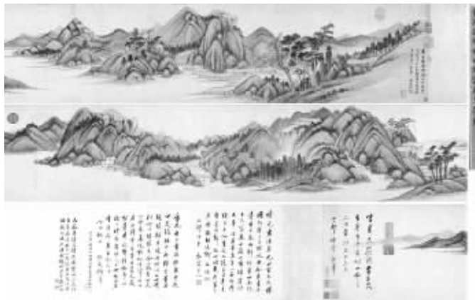
董其昌《仿黄公望富春大岭图》在中国嘉德秋拍以6267.5万元成交