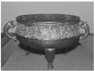
宋代饕餮纹鼎式炉

炉制作的巅峰阶段,工匠们在长期制作过程中积累了精湛的技艺,形成了独特的传统,在中国工艺美术史上独树一帜。“琴书侣”款铜香炉便是其中最具有代表的一类。“琴书侣”即吴邦佐,是宣德铸炉时的工部吏臣,也是开铸仿宣的最大功臣。邱先生收藏的这件“琴书侣”铜香炉造型小巧玲珑,弧度自然,线条流畅,底部款识端庄、字体利落、做工精致,此造型也被称为“桥耳炉”。该炉是“琴书侣”三字款,反映出古代文人雅士的一种生活状态。他介绍说,明代香炉以周商青铜礼器为造型蓝本,有鼎形、簋形、鬲形等多种款式。而宣德炉最早的仿制者吴邦佐,他按照铸造宣