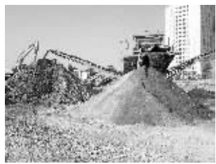
筛粉机吐出三种石料

你知道吗?建筑垃圾都可以变废为宝。近日,南京首个建筑垃圾回收再利用点落户建邺区。这个建筑垃圾回收再利用点位于建邺区金洲路,靠近明基医院。昨天,现代快报记者走进厂区,这里堆放了七八千立方米的建筑垃圾。南京首佳再生资源利用有限公司副总经理陆林介绍,粉碎机“吃”下建筑垃圾,剔出钢筋、木材、塑料等物,剩下的进入筛粉机。筛粉机从三个出口吐出“成品”:一堆是直径10—20厘米的石子、一堆是直径5—10厘米较小一些的石子,而另一堆则是石粉。“石子可以用来铺路,石粉加入一些水泥,也可以来制砖。”据悉,这两个“大家伙”每小时能消化建筑垃圾300吨,24小时运作的话,凭这一套设备,南京每年1200万吨的建筑垃圾,就可以消化掉约四分之一。