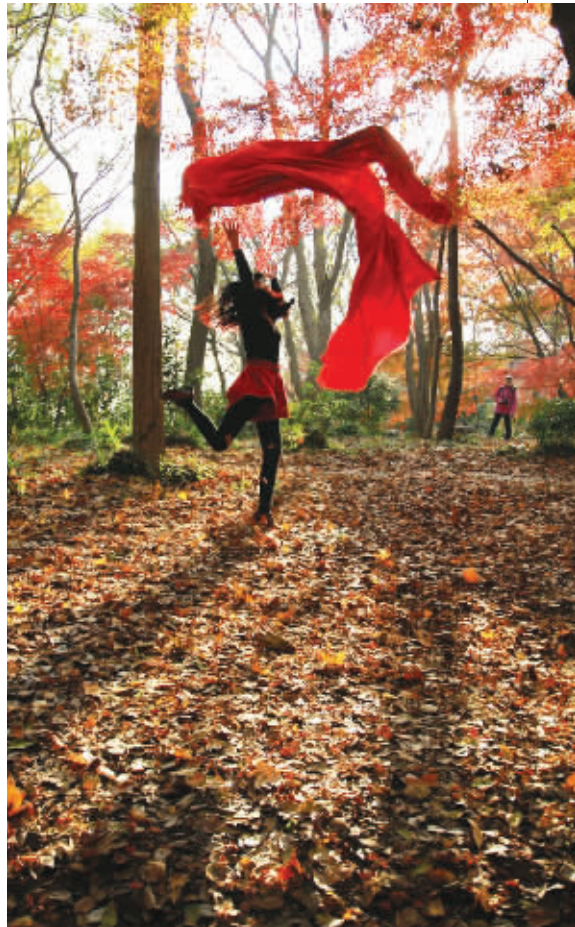
树林够红了吗?也许还不够,用手中的一抹红色,让红枫林燃烧起来。 11月29日摄于中山植物园 (作者颜英获30元话费)