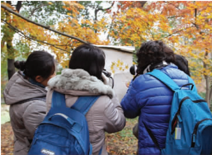
放弃了整座森林,我们只爱一枝独秀。12月2日摄于中山植物园 (作者陈丹丹获30元话费)