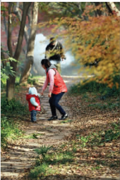
宝贝快跑!妈妈有点惊慌失措。原来是这位摄影大叔在做烟效,还以为走水了! 11月27日摄于中山植物园 (作者朱颜获30元话费)