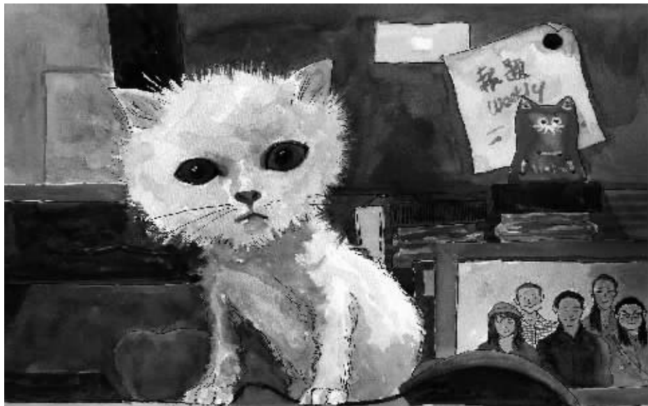
绘图/海角情人 插画师 美国 SND 插图奖获得者