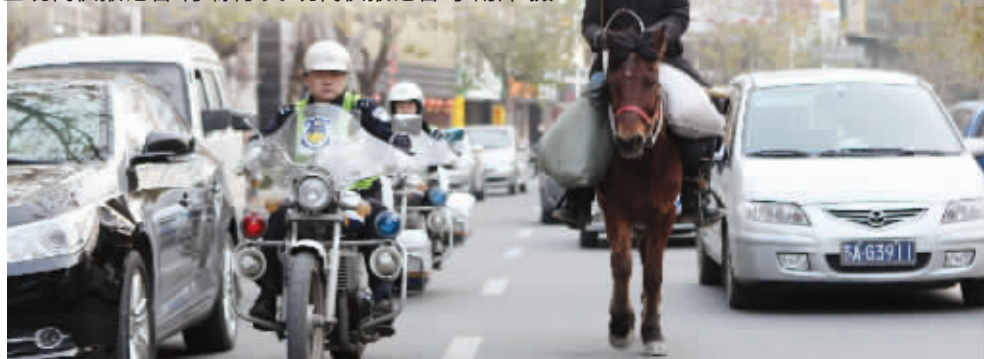
交警骑摩托开路,带他去住处