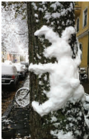
下雪可以激发我们的创意