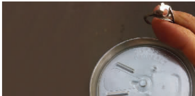
史上最悲剧的事莫过于此