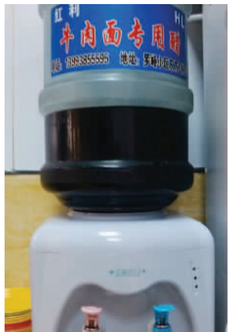
这样喝醋,你见过没