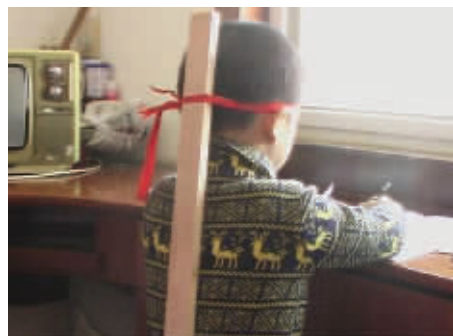
妈妈再也不用担心我的坐姿了