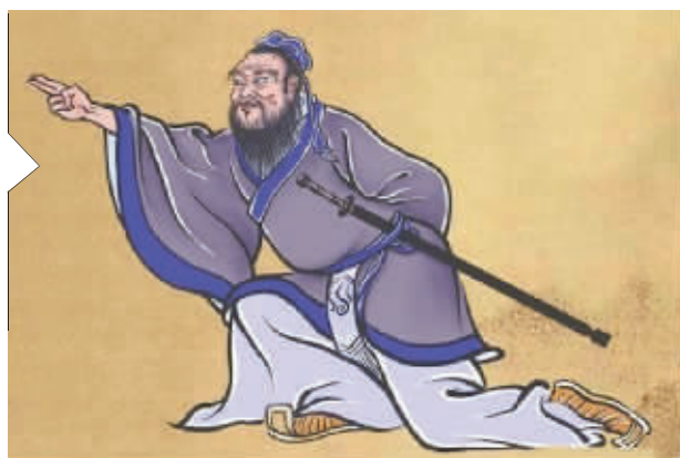
原来,“走你”是他发明的