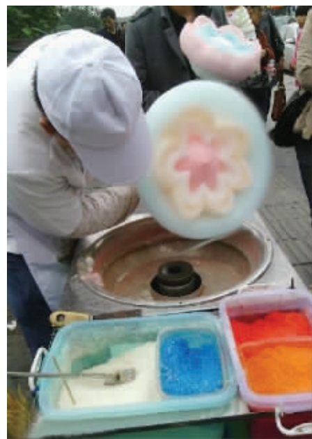
现在的棉花糖已经逆天了