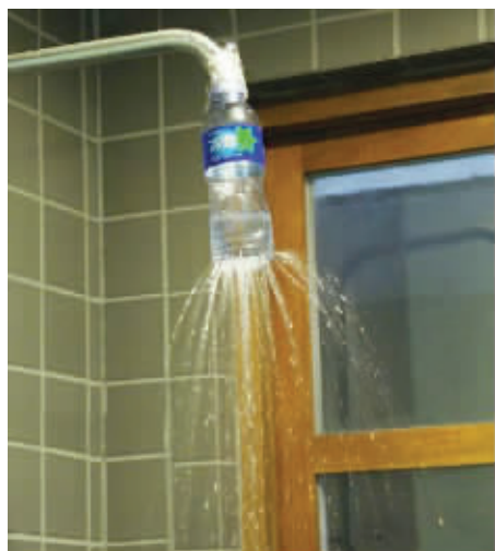
自己做一个,省力又省钱