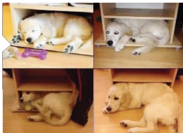
一条狗狗的成长记录