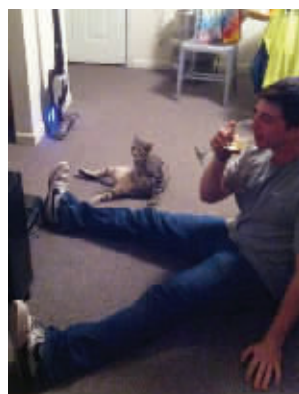
猫和主人一个德性