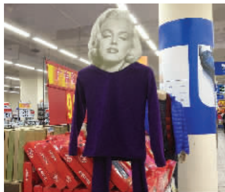
隆重邀请梦露作为模特