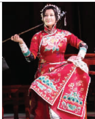
刘晓庆扮演的赛金花

记者在刘晓庆的微博上看到,提到《风华绝代》,她频频使用“100场”表达自己的愿望和目标。刘忠奎说:“就像刘晓庆在微博中说的那样,话剧,这个金字塔顶尖上的表演艺术,被《风华绝代》带到了各个地方。这几个月来,我们坐的火车比一辈子坐的都多,住的形形色色的酒店比见过的都多。可是,乐在其中。刘晓庆的目标不止是100场那么简单。现在算了一下,一年