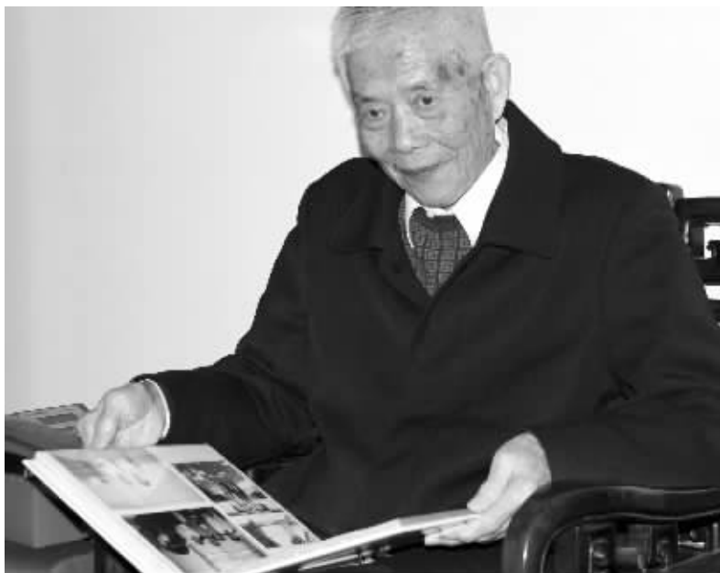
白英签协议的苦心令贫困生受益