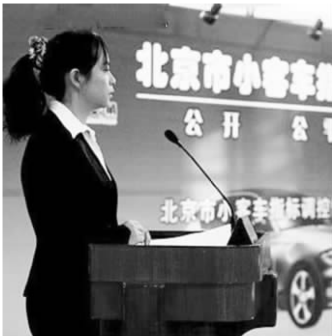
购车摇号现场(资料图片)