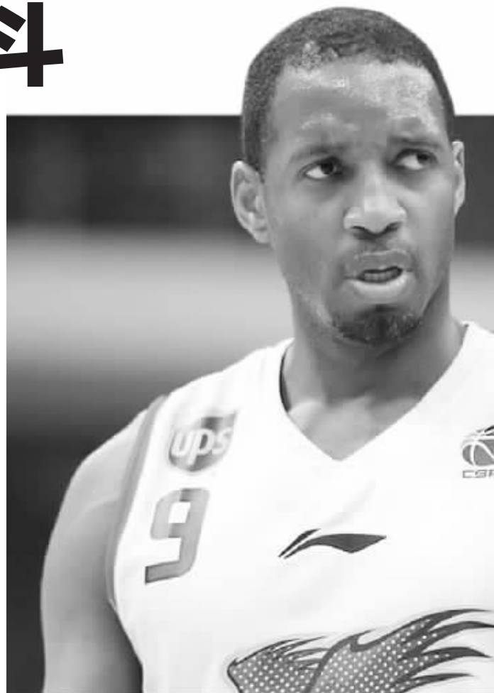
在CBA打拼,麦蒂不容易啊