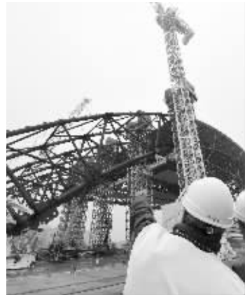
组装现场

11月27日, 在乌克兰切尔诺贝利, 工人们在观察拱形钢结构外壳的第一部分组装过程。