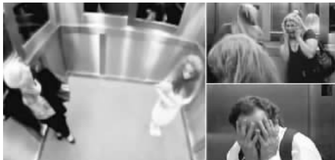
电梯中的乘客遭遇“恐怖贞子”