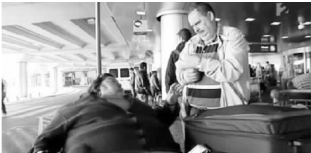
威尔玛与丈夫在机场