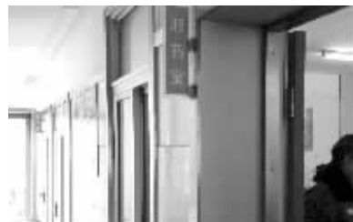
美沙酮门诊躲在医院一角不被人注意