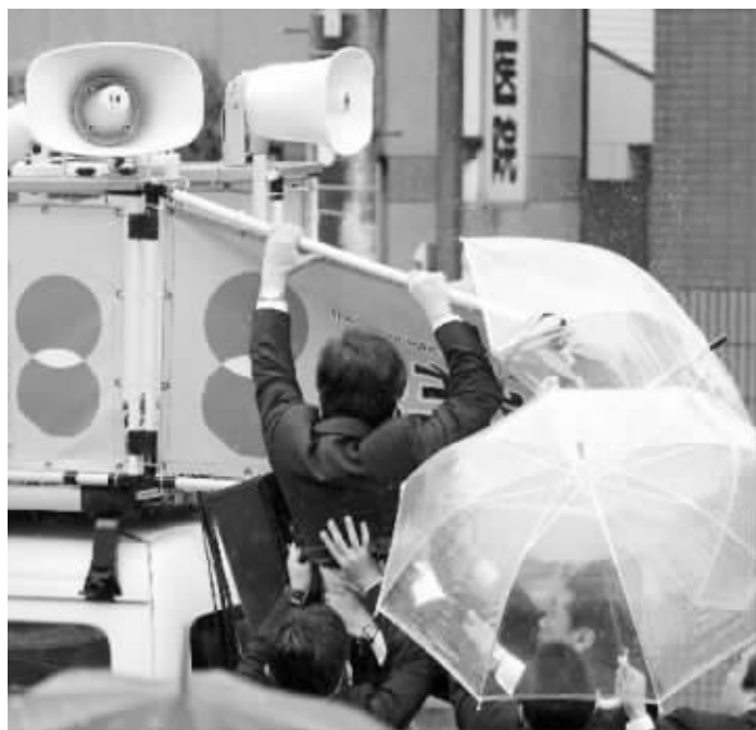
野田佳彦在攀登宣传车的梯子准备登上车顶讲演时,手没能抓住梯子,一下子摔了下来,幸有保镖在下面保护

11月26日是日本众议院解散的第十天,《读卖新闻》率先发布了第二轮民意调查结果,数据显示民主党的民众支持率进一步明显萎缩,而自民党、日本维新会的支持率波动并不大,安倍晋三领导的自民党目前暂时处于领先地位。