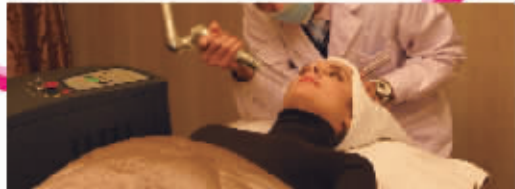
● 世界小姐尤利娅在维多利亚整形美容师检测美国Medlite祛斑平台

全球皮肤激光示范基地,全球抗衰老领先品牌,维多利亚整形美容独家引进美国FC复合祛斑工程,该祛斑工程全球首创色胚分层复合治疗,综合应用美国原装进口Medlite祛斑平台,TPI完美脉冲光、美国皮肤检测仪器等国际顶级祛斑美肤设备,针对黄褐斑、雀斑、太田痣、老年斑、咖啡斑、红血丝、色沉等皮肤色素性疾病,特别是黄褐斑、雀斑,一次即可见效!