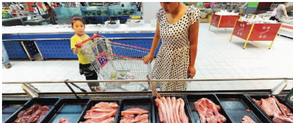
超市里的猪肉专柜

传言引发了不少网友的担忧,记者深入生猪养殖大省四川进行调查,并采访了农业部有关负责人,以回应舆论关切。