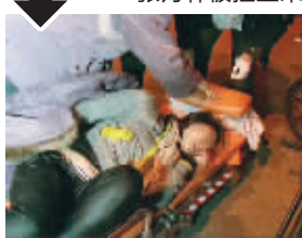
女子被抬上担架