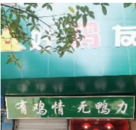
9. 为了与鸭脖子相抗衡,这家卖鸡肉的店豁出去了