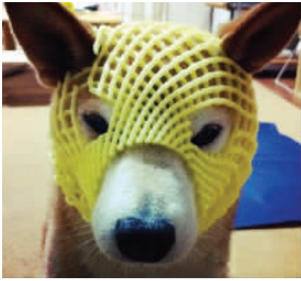
3. 所以我给我家的狗加了一个面罩,以后它的名字叫做“网兜侠”