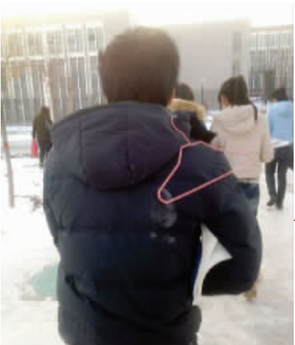
5. 出门了,这位学霸的羽绒服上有个衣架也浑然不知