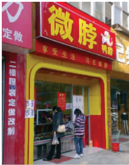
8. 都说微博很流行,楼下的鸭脖子店也时髦了一把