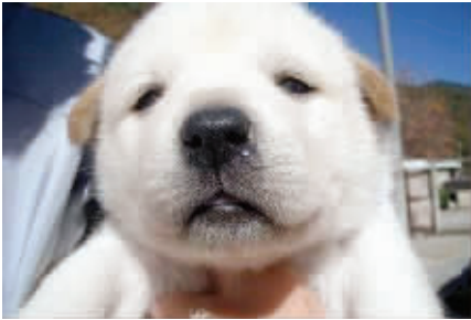
2. 冷空气袭来的时候,大家要注意防止感冒