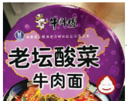
13. 回到宿舍,来一包方便面,结果,又被山寨了一把