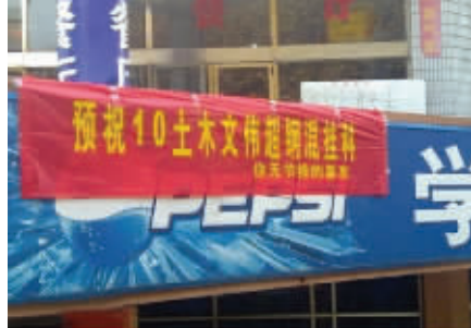
6. 气温低了,笑点低了,同学们的节操也掉了一地啊