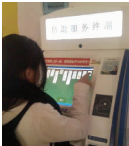
7. 这位同学不顾围观的目光,在自助终端前玩了一天纸牌