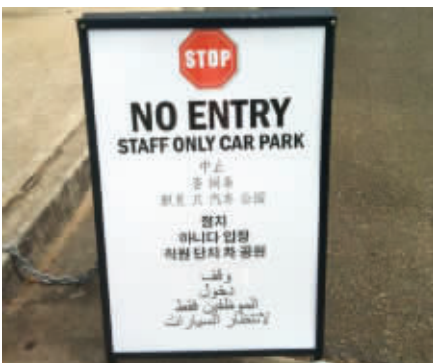
10. 国外的街头也好不到哪去,这个招牌是用谷歌翻译的吧