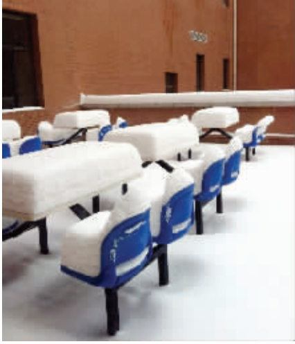
1. 冬天到了,北方的雪下得壮观,但北方人来南方更怕冷