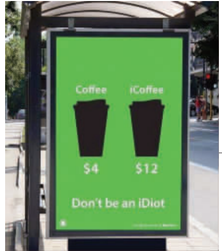
11. 也许这个冬天,会有国内厂家生产的羽绒服叫“iWear”