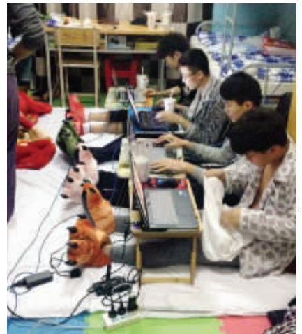
14. 最幸福的时刻,莫过于大家在一起打DOTA的时候