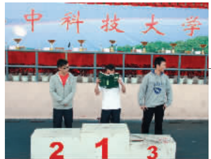
15. 冬天虽冷,但也挡不住知识的力量,大家加油哦