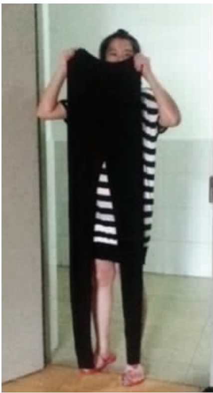
4. 拿出夏季珍藏的毛裤,咦,毛裤,你怎么长这么高了