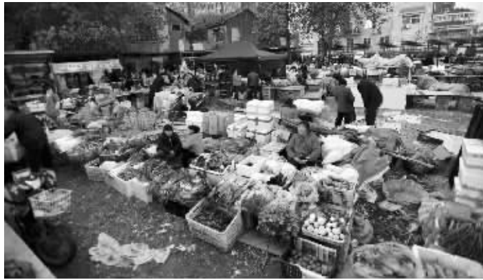
位于长白街一停车场内的过渡点

还有摊主担心,菜场改造,不仅短时间影响生意,一旦不能重新拿到摊位,原来的老客户就全丢了。