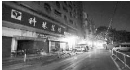
暂停营业后,科巷菜场周围干净多了