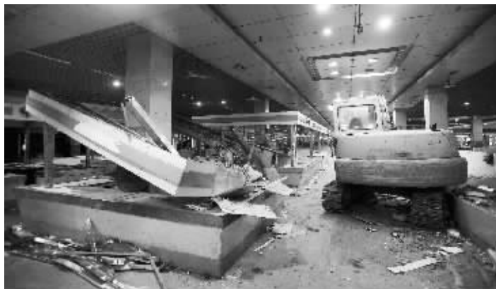
菜场内部开始清空