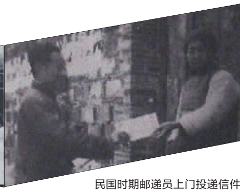
民国时期邮递员上门投递信件