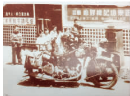
民国时,用来送邮件的摩托车

当年5月,又增设了一条途经夫子庙小公园、新街口、鼓楼,直到山西路口的“京沪特快信筒”摩托车邮路,凡在21点40前投入信筒寄发京沪沿线以及上海经转的各地信件,均可以赶交当晚23时的京沪快车发出。