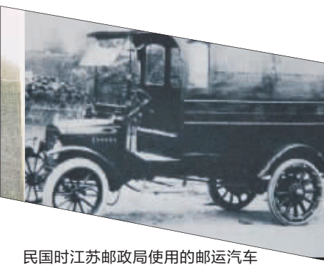
民国时江苏邮政局使用的邮运汽车