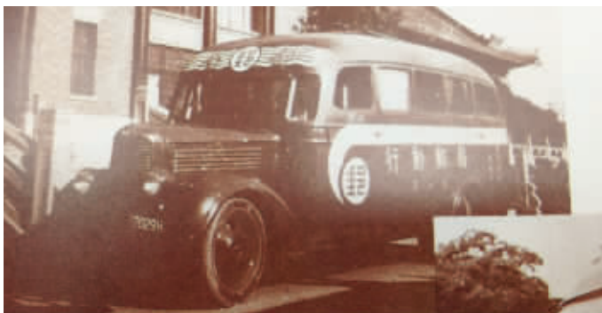
1947年南京第一号汽车行动邮局