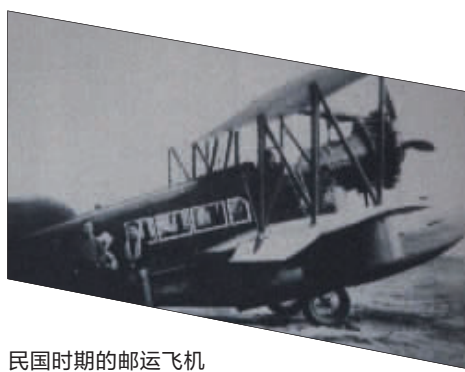
民国时期的邮运飞机