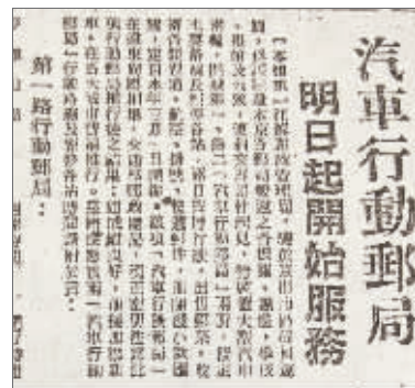
1947年2月28日的《中央日报》报道了汽车行动邮局开业的新闻