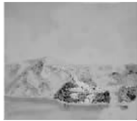
翁凯旋《雪融系列(一)》