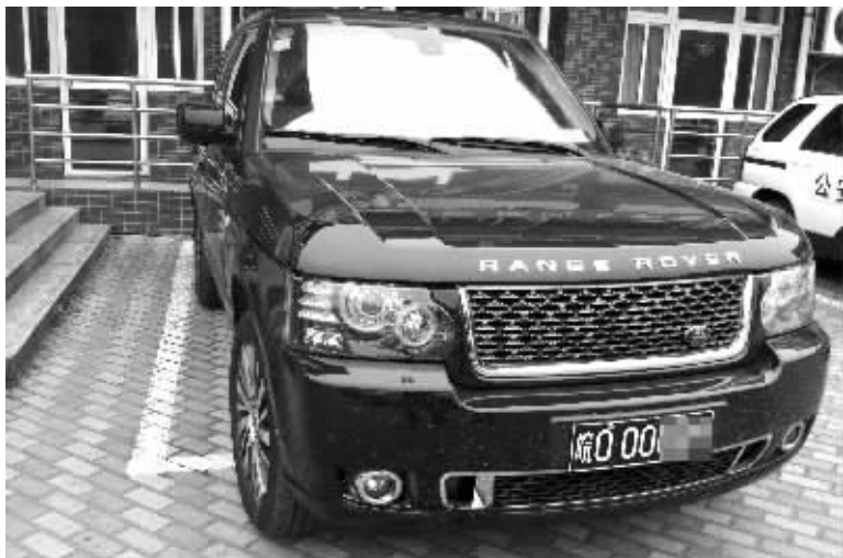
被扣的路虎