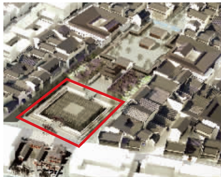
科举博物馆效果图