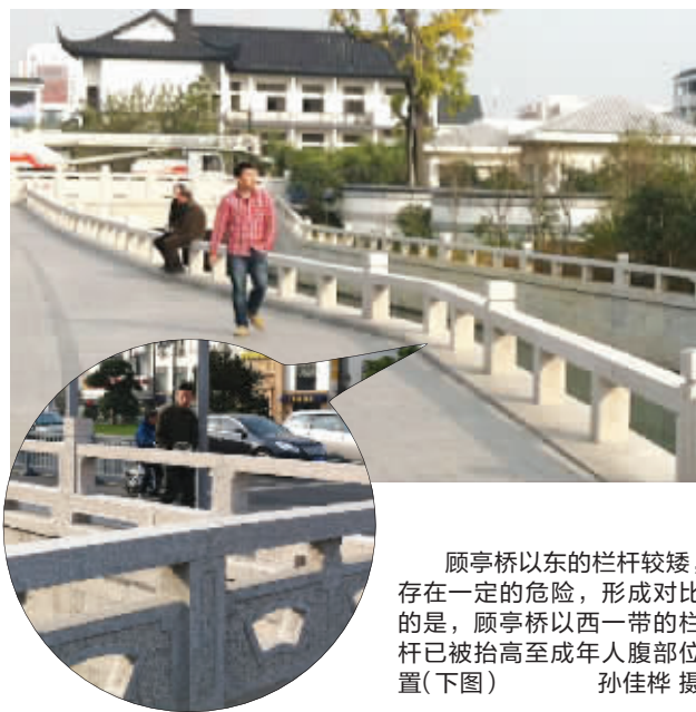
顾亭桥以东的栏杆较矮,存在一定的危险,形成对比的是,顾亭桥以西一带的栏杆已被抬高至成年人腹部位置(下图)