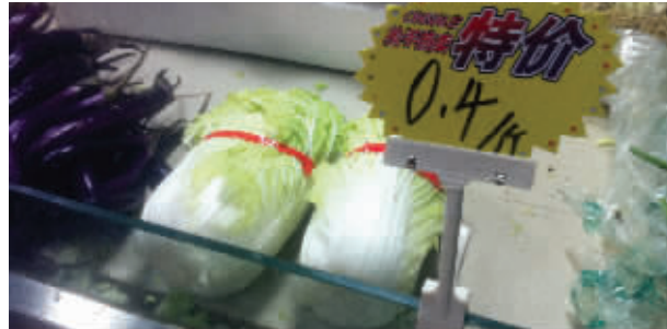
大白菜的价格降到了几年来的最低

记者看到,在其中的一个摊位前,放置着一张价格牌,上面写着特价0.4元/斤,牌子后面整齐地放置着几棵大白菜。摊主告诉记者,大白菜的价格在这个月里“大跳水”。10月份的时候,大白菜的价格还在每斤1元以上,有些摊位甚至卖到每斤2元,大约从上周开始,大白菜的价格越来越低,几乎每