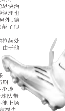
达纳拉赫,你快回来