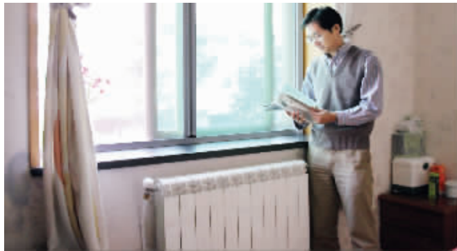
科宁舒适家居将参加快报秋装荟,它打造的“和暖工程”一天可以让你的家温暖起来。

蒙娜丽莎之午后印象(800×800地砖)原价245元/片,快报买断价79.8元/片;李洋番龙眼实木地板(柚木色,规格为910×75×18毫米)快报买断价148元/平方米,帅康橱柜+帅康油烟机灶具(奥地利爱格系