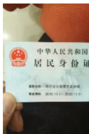
属于光棍的身份证