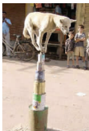
杂技不只属于人类