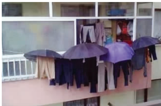
教你怎么在雨天晒衣服