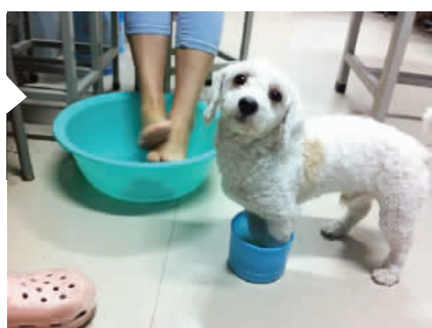
天冷了,你也泡泡脚