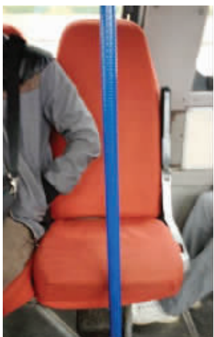
让人无语的公交座位