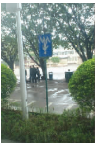
这走路技术,好像难了点