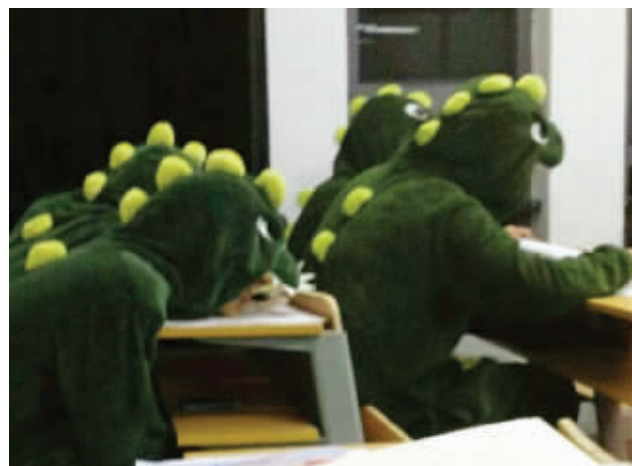
这把宿舍舍服穿出来了没