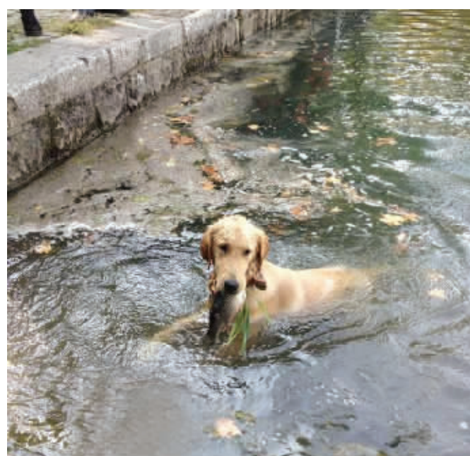
这是跨越种族的技术