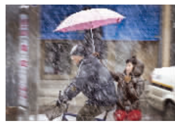
12日,吉林市,雪中行人