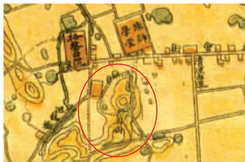
1910年的地图上标注到了妙耳山和陆师学堂

站在附近的高楼上向下望去,因为山上树木茂盛,整座山更像一个精美的盆景嵌在小区里。