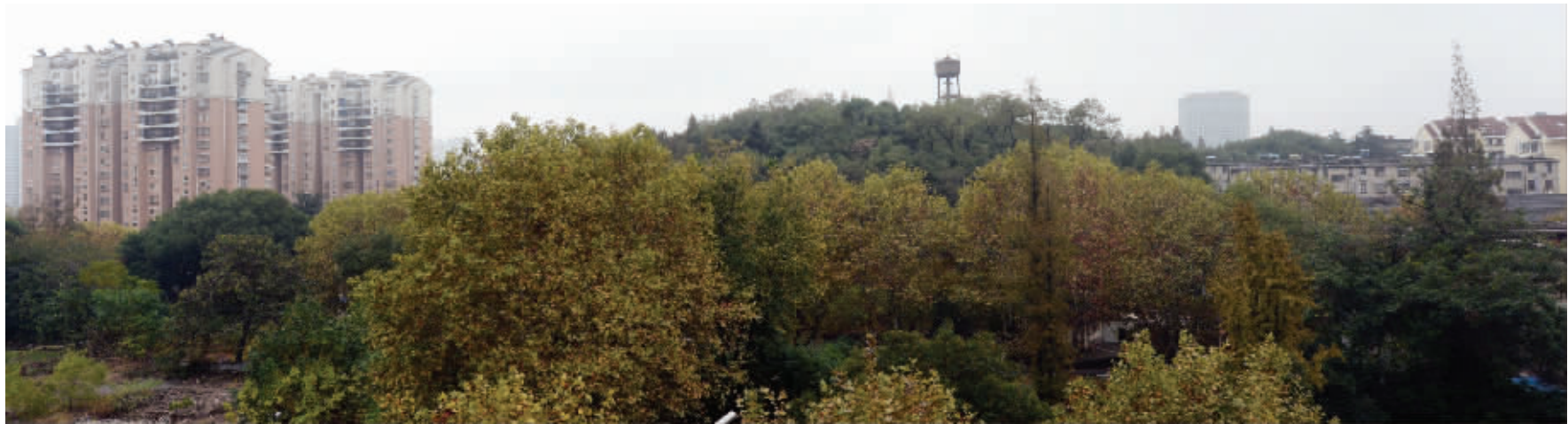
在周边的高楼上看妙耳山,这座山像一个精美的盆景嵌在小区里