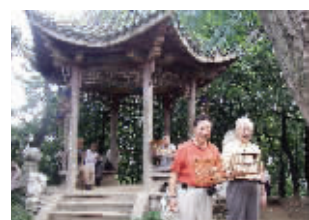
居民在妙耳山上十分惬意