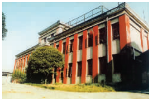
坐落在妙耳山上的十四所小红楼