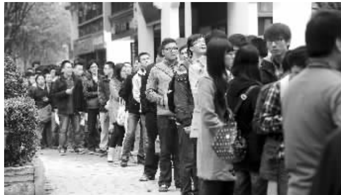
报名点前排起长队

来自南京工程学院的小刘轻松自如,目前他已经与一家建筑公司签约,成为一名造价工程师,“我个人还是挺想工作的,但家人强烈建议我再考研究生,如果考上了就去,考不上正好工作。”虽然从7月份就开始准备考研,但由于有offer在手,小刘的心态很放松。