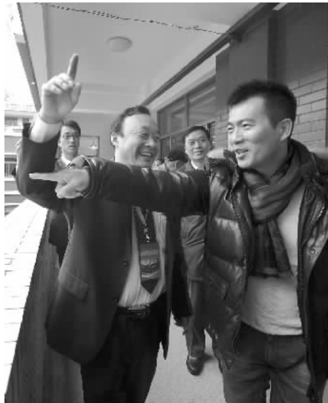
黄健翔昨天来到丁家桥小学