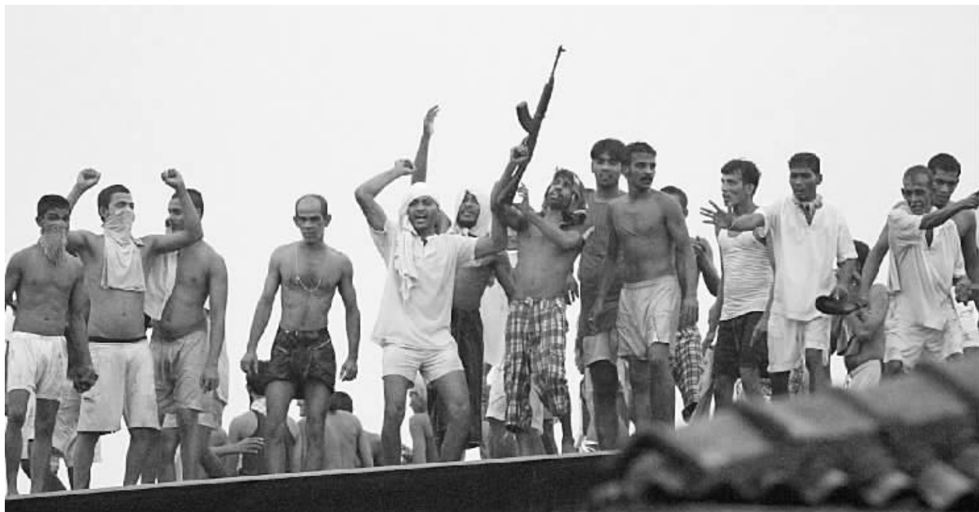
发生暴乱的监狱,有犯人手持武器站在屋顶

“人们不知道我们是搭档,总是反应一会儿后才恍然大悟。”萨尔迪亚说,“我常听到有人大喊,最典型的话是‘天哪,他的肩头有只猫!太有趣了’。”萨尔迪亚说,MJ喜欢费城街头的喧闹,喜欢风扫过它皮毛的感觉,会在他的两个肩头移动。唯一能吓到它的是古怪的汽笛声。 据新华社