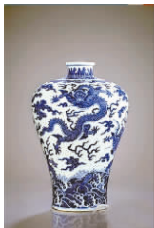
北京盈时2012秋拍拍品清乾隆青花海水祥云应龙纹梅瓶暂居秋拍榜首