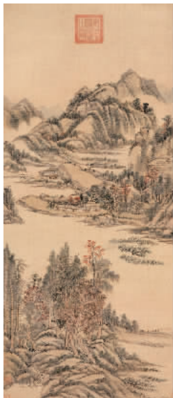
北京盈时2012秋拍拍品王原祁《秋林远黛图》

马学东认为,市场不明朗的情形下,卖家比买家更为谨慎,在好的作品惜售时使拍卖公司征集难度加大。西沐也表示了相似的观点,艺术品持有者对艺术品价格的预期很高,可是市场中大量的进场资金在观望,目前出现一种僵持状态,“惜售”与“惜买”之间在博弈,这致使艺术品市场陷入了僵局。