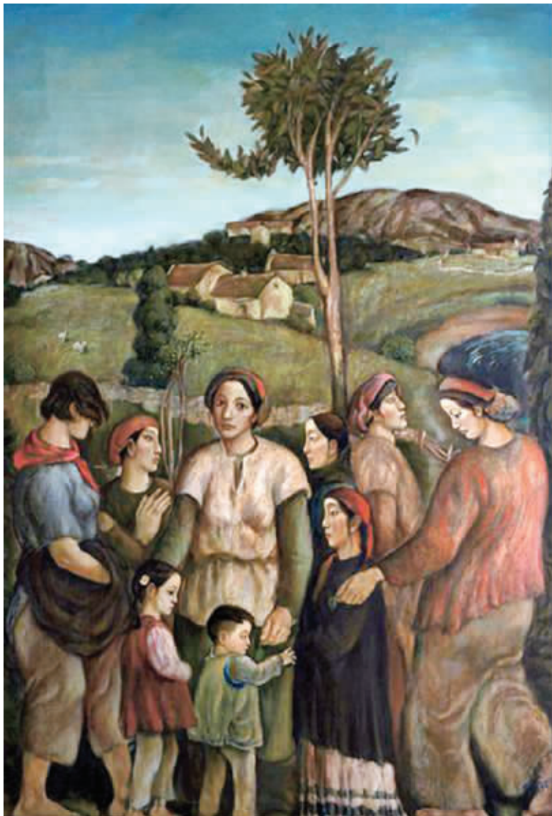
中国嘉德2012秋拍拍品叶永青《牧羊村的姐妹们》遭遇流拍