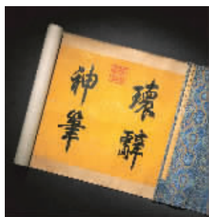
北京嘉德2012秋拍拍品《张照书韩愈石鼓歌》(局部)

随着中国嘉德2012秋拍于10月31日结束,秋拍市场的第一轮拍卖收官。从整体的趋势来看,艺术品市场延续了今年春拍下滑的走势,拍品数量明显减少,成交额同比下滑,成交率也并不高。从板块细分上看,油画出现明显下滑,而相对应的,古代书画和高端瓷杂精品价格保持着坚挺。