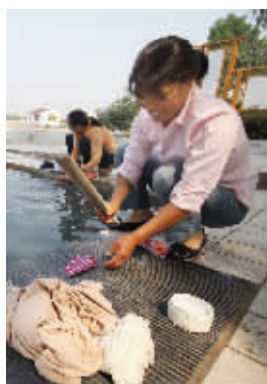
陈庄村村民在池边洗衣服