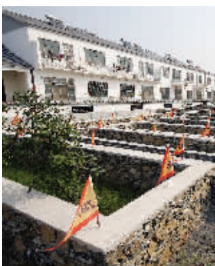
瓦殿村关口章组的“章字型”迷宫