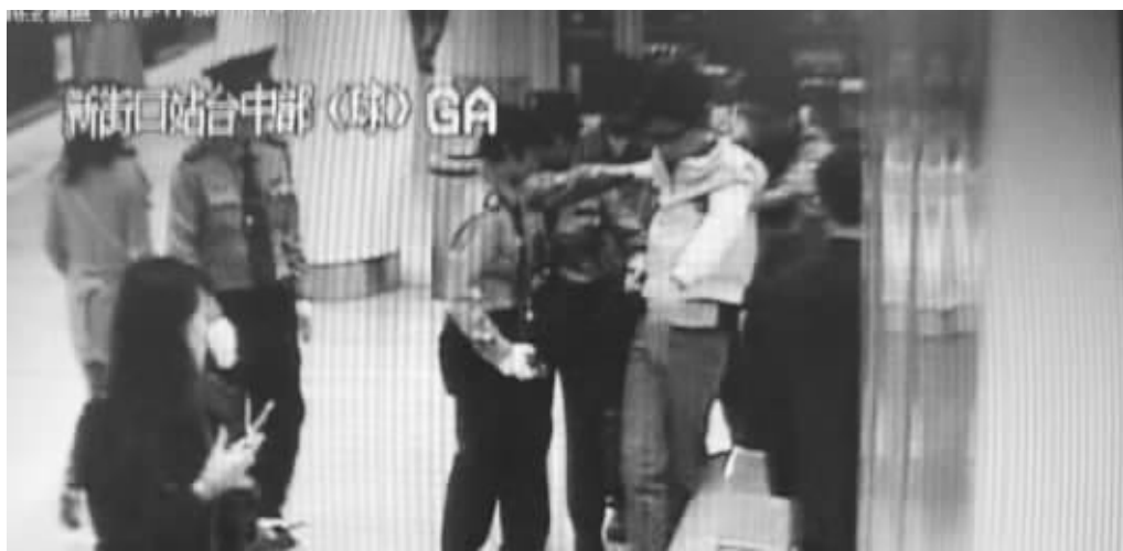
新街口站工作人员搀扶晕倒小伙休息