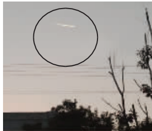
宜兴上空不明物体

11月4日,在宜兴某知名论坛上,有网友发帖说,在空中看到了“不明物体”,这个帖子引来了网友的热议,不少网友表示也看到了这一奇景。