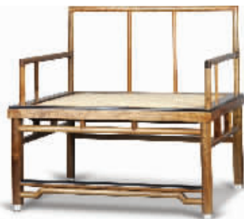
据主办方介绍,就是这把“燕集椅”卖了50万元 资料图

一套名为《似合院——苏坐》的创意坐具6张椅子环环相连,乍一看让人似乎不知道该如何坐。据介绍,该作品源于城市拆迁安居房公共设施设计的课题,其涵义在于城市化进程中,越来越多的乡镇居民面临着拆迁搬家的问题,不同