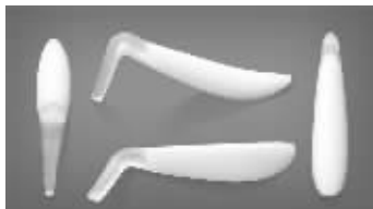
▲硅胶为L形成型假体 ▲膨体需要由块状雕琢成最终成型假体