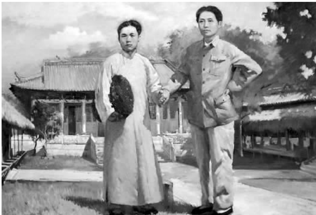
孙逊群在广州参加第六届农民运动讲习所时,向毛泽东详细汇报了江阴、沙洲农民运动的情况(油画)

《星光》报的出现,使江阴当局如临大敌,派出警探四处侦查,周水平因此牺牲了生命。1926年1月17日,孙逊群撰写《鸣冤宣言》在《申报》发表。同时,撰写了五更调《十哭周水平》,揭露周案之真相,痛斥军阀政府倒行逆施之罪行。