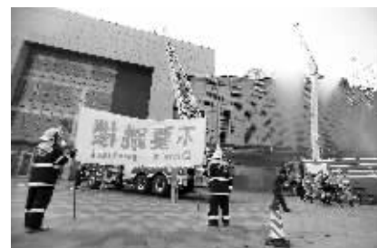
消防演练现场

快报讯(记者 田雪亭)高楼遇到大火,千万不要跳楼。11月1日,在江苏省第二个消防宣传月启动仪式现场,参加消防演习的消防队员打出了一块巨幅条幅“不要跳楼”,提醒遇到火灾时,除非万不得已,尽可能不要选择采用跳楼的方式。