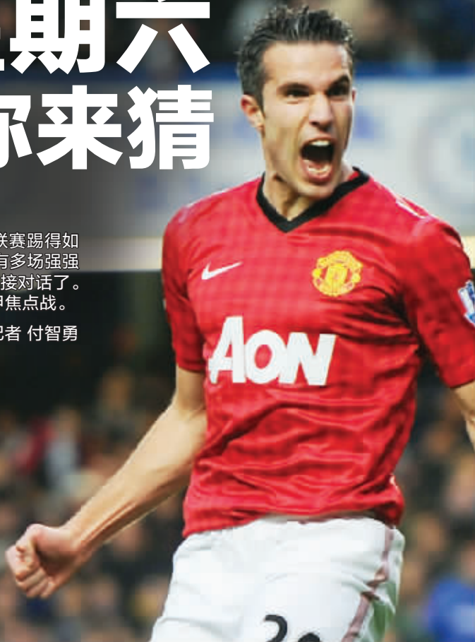
曼联最大的问题就是球队的防守