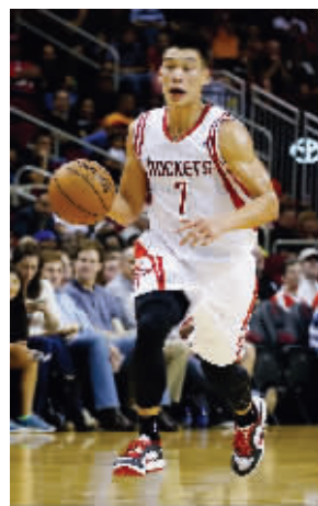
林书豪首场表现不错

火箭在首轮比赛中客场大胜活塞,这场比赛哈林组合表现抢眼。哈登将成为火箭队的新领袖,而林书豪则展现出了自己在组织方面的才能。首轮