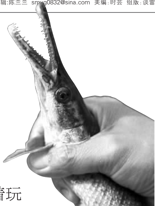
雀鳝的牙齿尖细锋利