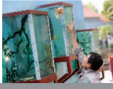
饲养员将食物抛进喂食箱