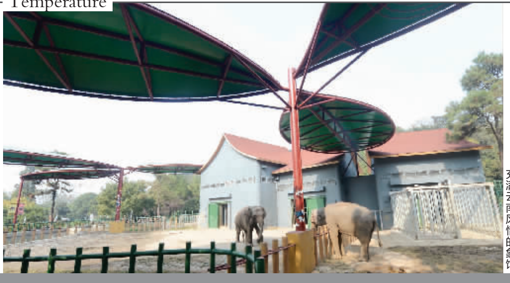
本组图片摄影 现代快报记者 赵杰 充满云南风情的象馆